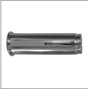
Inslaganker met kraag verzinkt

Uitvoering met kraag voor een gemakkelijker correcte installatie.